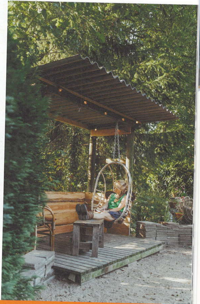
'Het is mijn droom om hier op BlueWoods oud te worden'